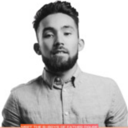
MEET THE ENIGMA OF FATHER HOLES POM ARNOLD

Pom was hij onder andere te zien in Holland's Got Talent, THE IMMORTAL WORLD TOUR van Cirque Du Soleil (USA) en heeft ook in de Nederlandse theaters gestaan met verschillende theatervoorstellingen. Hij omschrijft zijn stijl als minimalistisch, clean en met een sterke basis.